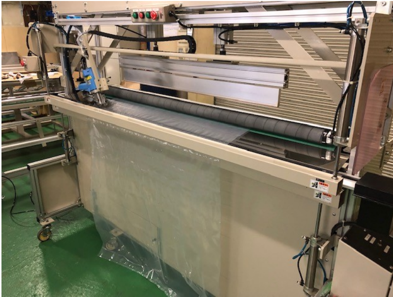
シーラーユニット