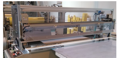
裁断装置本体 (吐出テーブル側)