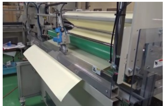
カッターユニット部