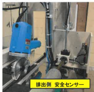
排出側 安全センサー