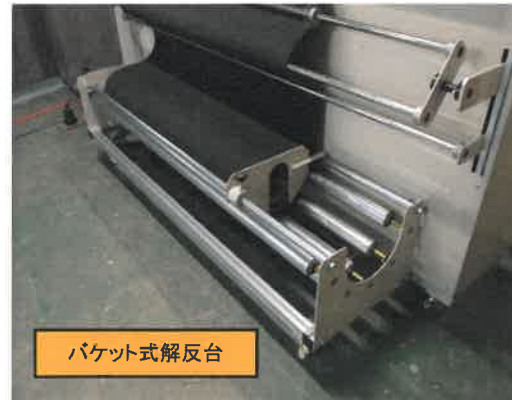
バケット式解反台