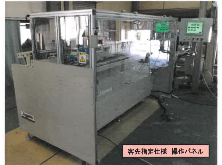
客先指定仕様 操作パネル

お客様のご要望に合わせた スタック☆カッターを製作します (ビデオ内容とは相違しています)