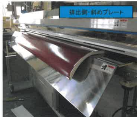
排出側・斜めプレート