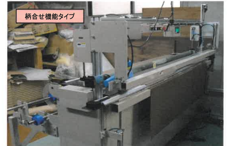
柄合せ機能タイプ