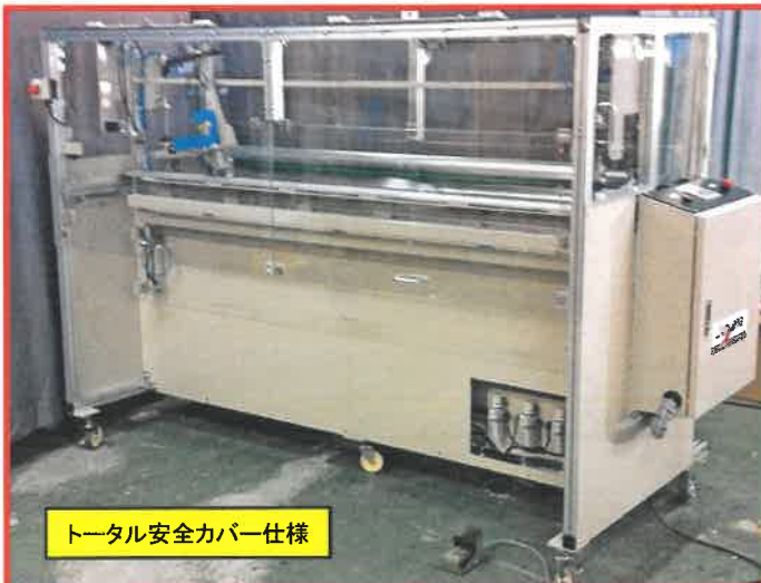
トータル安全カバー仕様