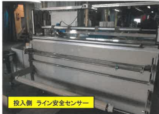
投入側 ライン安全センサー