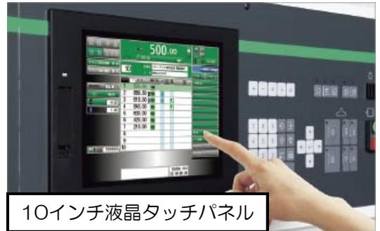
10インチ液晶タッチパネル