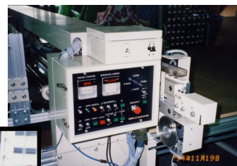
ナイフ・ヒート切替